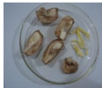
صورة (2) : الأجزاء النباتية المعدة للزراعة

نقلت الابصال بعد ذلك إلى كابينة انسياب الهواء الطبقي حيث اجريت لها عملية التعقيم السطحي بكلوريد الزئبق بتركيز 0.1 % لمدة 30 دقيقة، ثم غسلت بالماء المقطر المعقم ثلاث مرات لمدة 5 دقائق لكل مرة، وازيلت الأجزاء المتضررة نتيجة التعقيم ثم قطعت الابصال في طبق بتري معقم إلى اجزاء نباتية شملت الجزء السفلي والمكون من القرص القاعدي والجزء العلوي مكون من الأوراق الحرشفية والذي بدوره قطع إلى اربعة اجزاء طولية بعد ازالة البرعم القمي صورة (2).