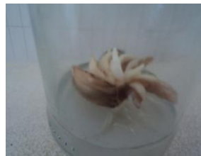
صورة (5) : الأفرع الخضرية المتفتحة من الأوراق الحرشفية لأبصال النرجس