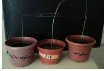
صورة (7): إنبات البصيلات بعد زراعتها على أوساط زرعية مختلفة

المكون من البيتموس مع التربة النهرية بنسبة 1:1 تلتها البصيلات النامية في الوسط المكون من البيتموس فقط، إذ أعطت البصيلات النباتية نموات خضرية جيدة صورة (7) إلا أنها لم تزهر في الموسم نفسه. ولذلك فقد أوصى الباحثون بضرورة معاملة البصيلات الناتجة خارج الجسم الحي بدرجة حرارة 4 درجة مئوية لمدة شهرين لكسر طور سكونها قبل إنباتها [14].