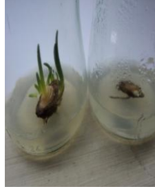
صورة (3) : الأفرع الخضرية المتفتحة من القرص القاعدي : اليمين : الأفرع المتفتحة في الظلام ، اليسار : الأفرع المتفتحة في الضوء

وتتفق هذه النتيجة مع [12] إذ حصلنا على كالس بدلاً من الأفرع الخضرية عند زراعة اجزاء نبات Narcissus pseudonarcissus على وسط مجهز بتركيز عالية من الاوكسين . كان للتداخل الثلاثي بين نوع المعاملة و تراكيز BA و NAA ذو فروق معنوية في معدل عدد الأفرع المتفتحة، إذ تفوقت معاملة التداخل : ضوء + 7.0 ملغم / لتر BA + 0.0 ملغم / لتر NAA (15.8 فرع) معنوياً على جميع التداخلات صورة (3). ولوحظ تكوين ابصال عند قواعد الأفرع المتفتحة في معاملة التداخل: ضوء + 3.0 ملغم / لتر BA + 3.0 ملغم / لتر NAA. تتفق هذه النتيجة مع [11] عندما حصلوا على افرع خضرية لنبات Narcissus asturiensis وبعد شهرين تكونت بصيالات صغيرة عند قواعد الأفرع على وسط MS المحور والمجهز ب BA و NAA. في حين اشار [21] إلى زيادة عدد الأفرع في وسط مجهز بتراكيز واطنة من NAA و تراكيز عالية من BA وزيادة تركيز السكر إلى 11% مع تحضين الزروعات في الظلام عند اكثارهم لابصال Allium sativum . وانخفض معدل الأفرع الذي كان مقترناً بتكوين الكالس في تداخلات الظلام مع تراكيز BA و NAA ، ولم تعط الأجزاء المزروعة على الوسط الخالي من منظمات النمو اي استجابة لتكوين الأفرع سواء في الضوء او في الظلام.