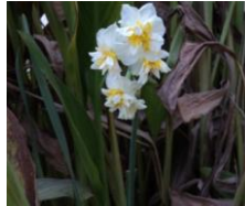
صورة (1): ازهار نبات النرجس

جمعت ابصال النرجس Narcissus tazetta L. من مدينة سنجار - محافظة نينوى، إذ يمتاز هذا النوع بازهاره البيضاء يتوسطها اللون الاصفر ذات رائحة زكية وقوية، تحمل الازهار بشكل نورة زهرية مكونة من 3-5 ازهار على قمة حامل زهري واحد يتراوح طوله بين 40-20 سم يخرج من البصلة من اسفل التربة. وتتفتح الازهار متتالية لتكون ما يشبه التاج على قمة الحامل الزهري، إذ تستمر فترة الازهار لكل زهرة إلى اسبوع، ويزهر النرجس في شهر كانون الثاني صورة (1). ويكون قطر الابصال حوالي 6 سم تحيط بها اوراق حرشفية غشائية جافة بنية اللون تحميها من الجفاف [3].